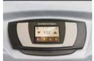
I-TOUCH™ LCD BEDIENFELD